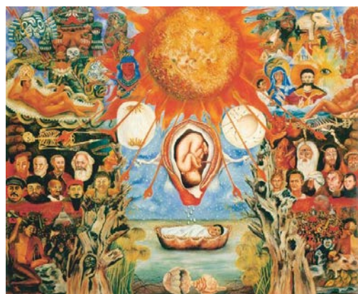
Frida Kahlo: Mózes vagy a Teremtés csírája