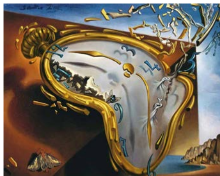
Salvador Dalí: Lágy óra az első robbanás pillanatában